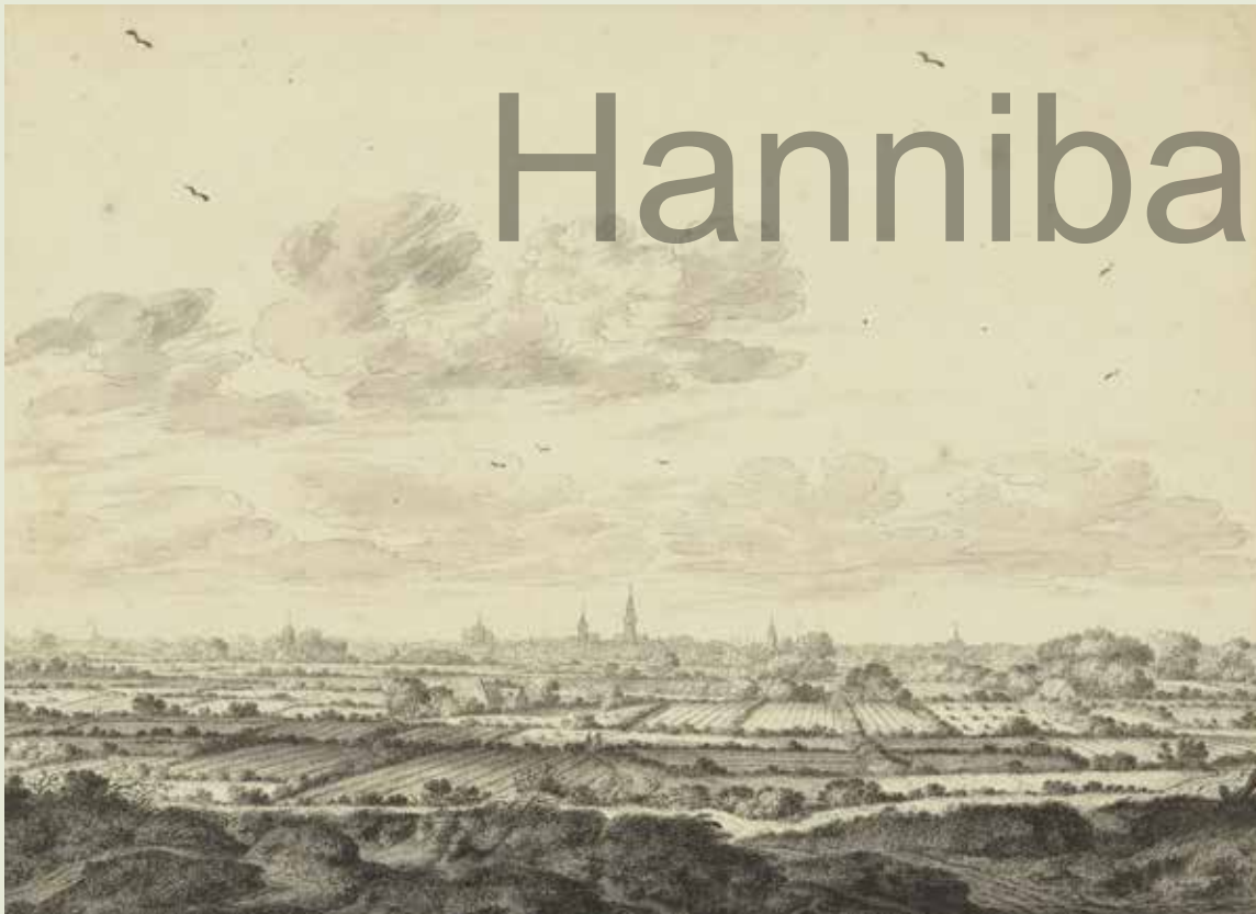
Gezicht op Middelburg door Johannes Goedaert, 1650 View of Middelburg by Johannes Goedaert, 1650 Ansicht von Middelburg von Johannes Goedaert, 1650