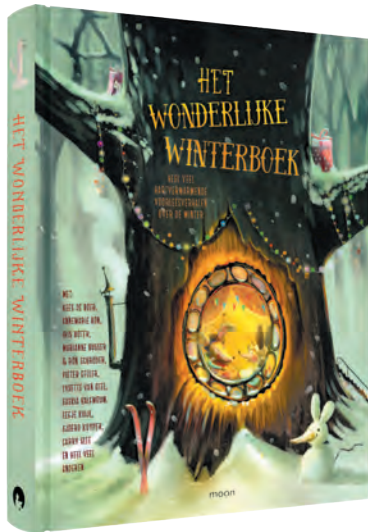
Het wonderlijke winterboek