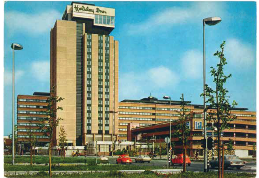
Holiday Inn, Utrecht, Nederland