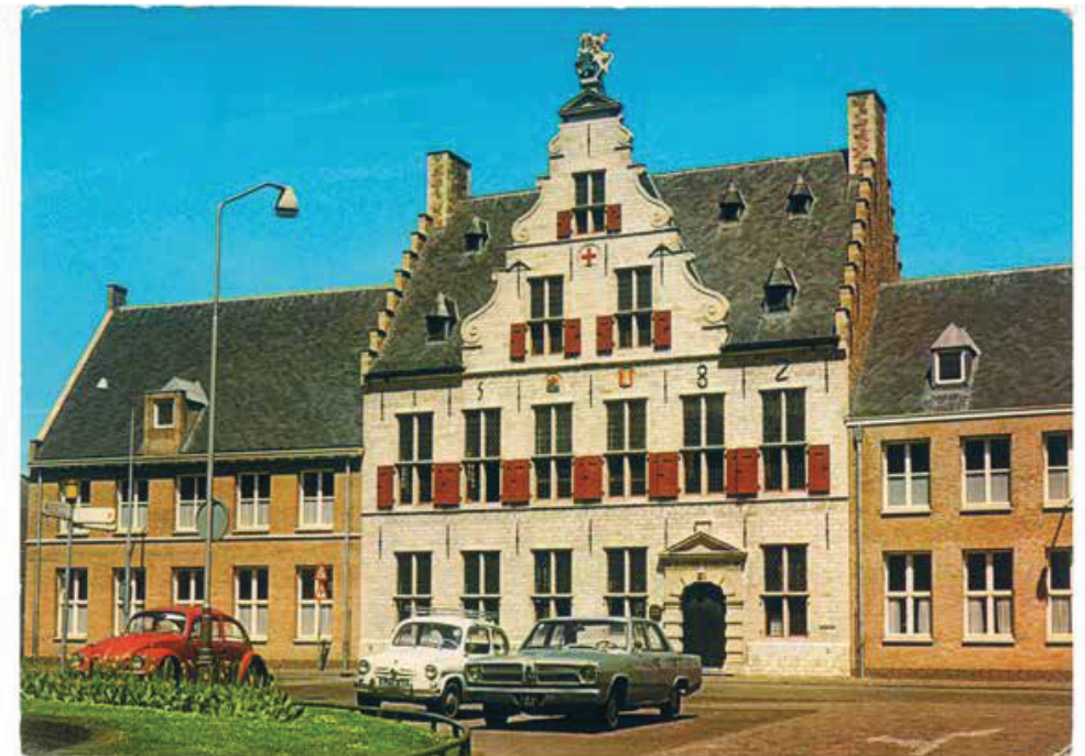
St. Joris Doelen, Middelburg, Nederland