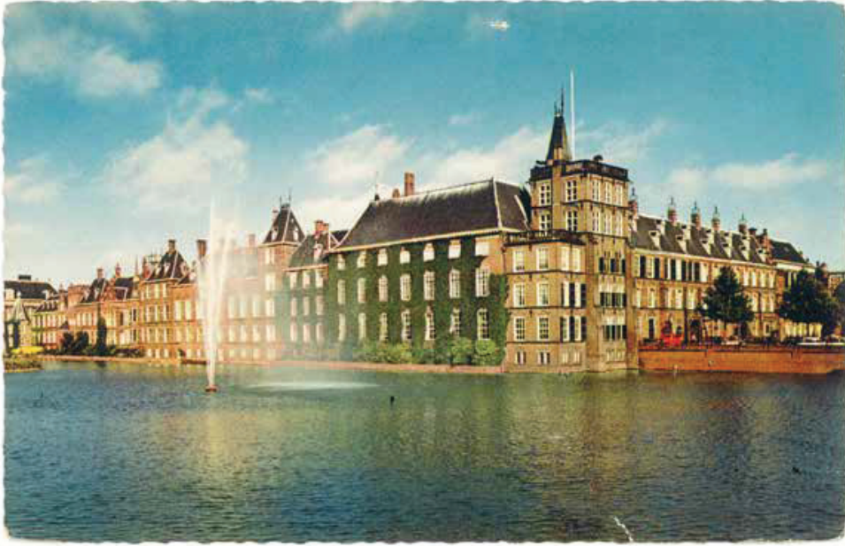
Hofvijver met Parlement, Den Haag , Nederland