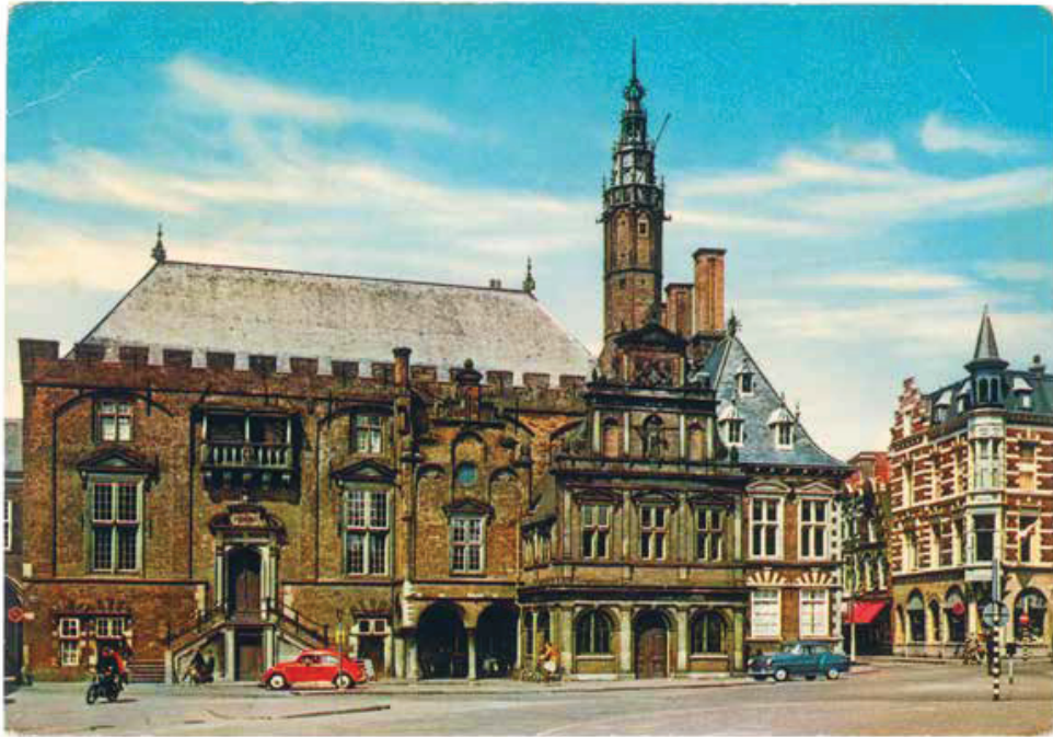
Stadhuis, Haarlem , Nederland