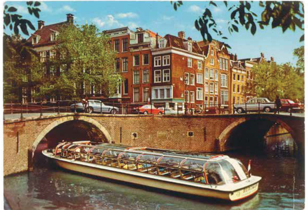
Herengracht met Reguliersgracht, Amsterdam , Nederland