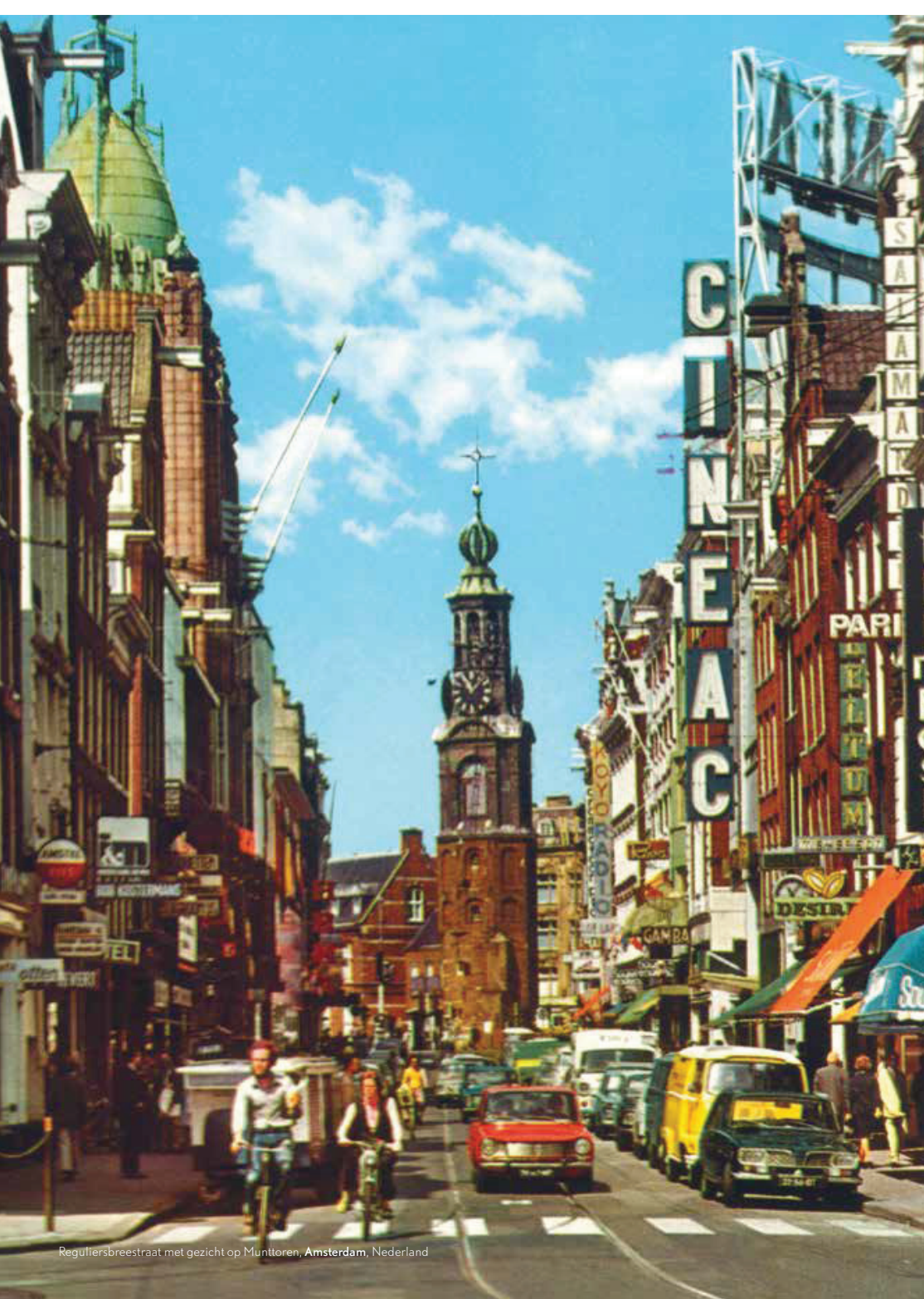
Reguliersbreestraat met gezicht op Munttoren, Amsterdam, Nederland