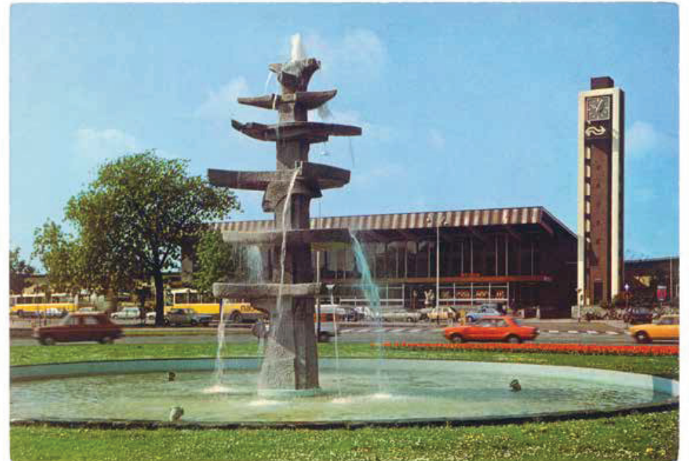
Station, Venlo, Nederland