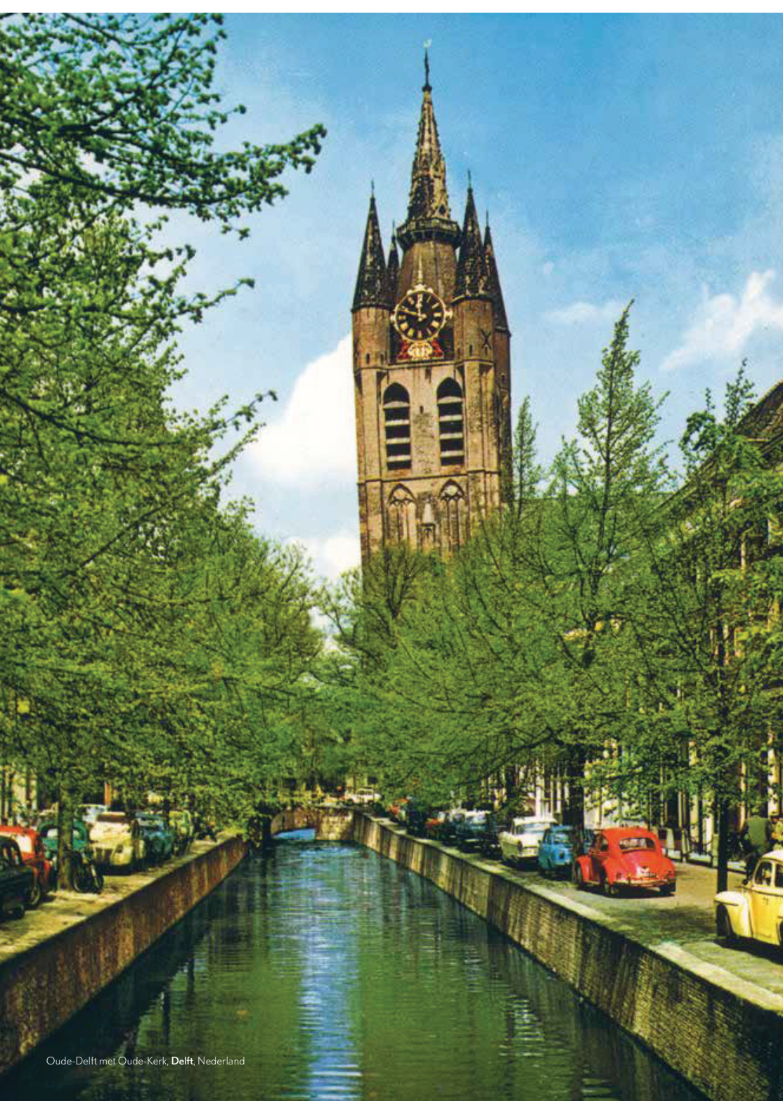
Oude-Delft met Oude-Kerk, Delft, Nederland