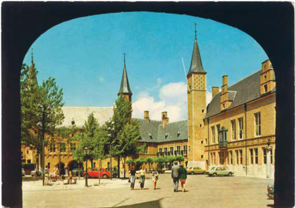
Abdij, Middelburg , Nederland