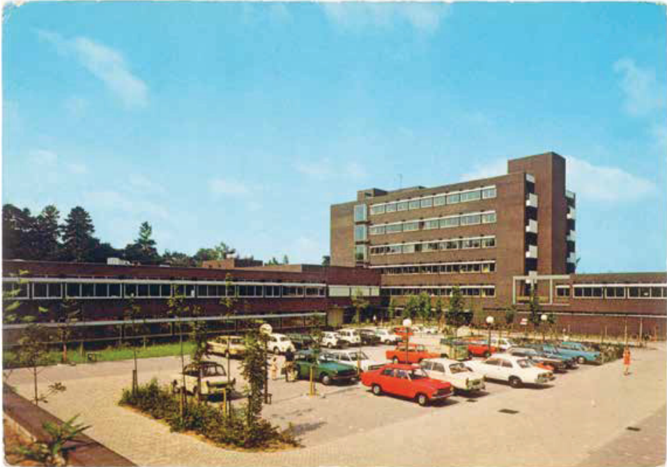
Ziekenhuis, Maarschalksbos, Baarn, Nederland