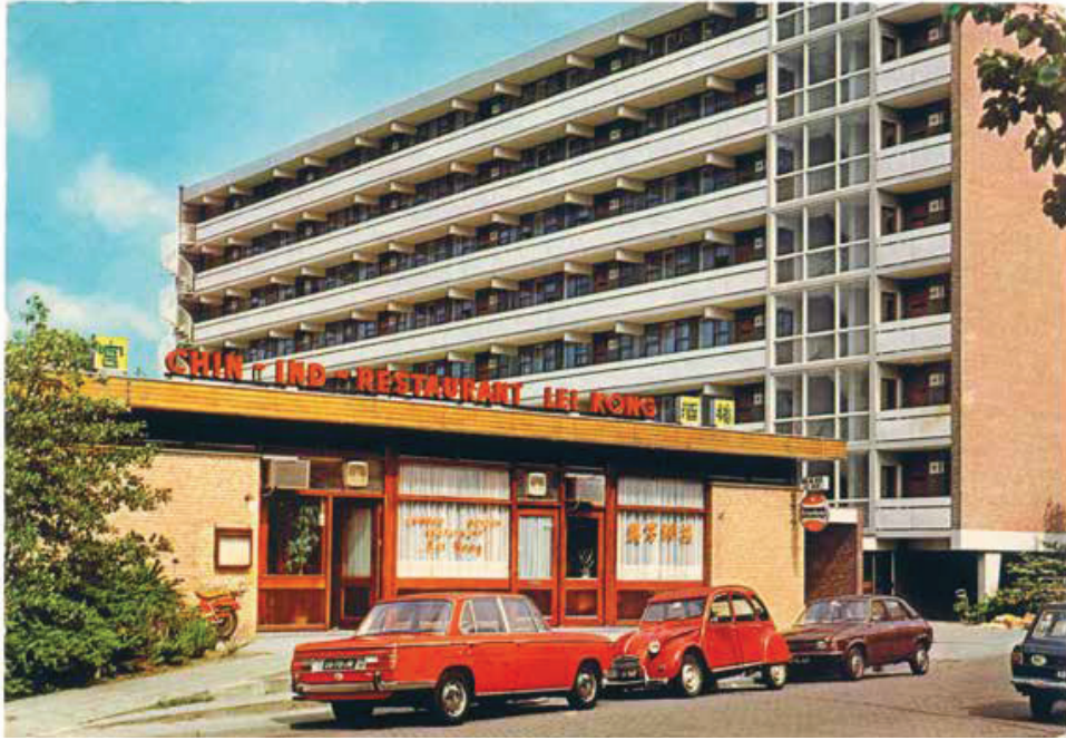
Chin. Ind. Rest. Lei Kong, Den Haag-Mariahoeve, Nederland