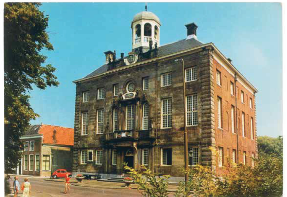
Stadhuis, Enkhuizen , Nederland