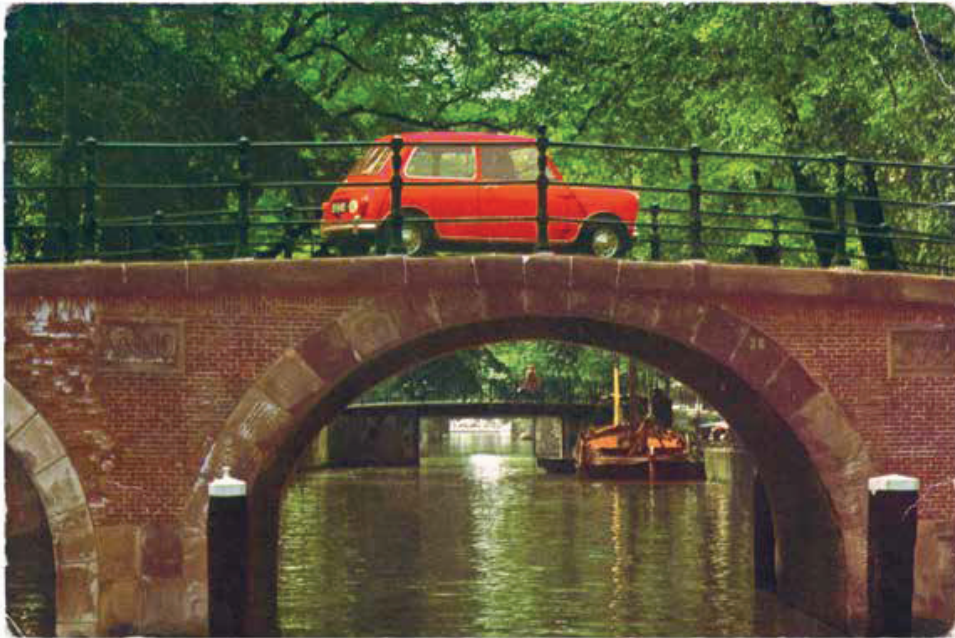
Oude brug, Amsterdam , Nederland