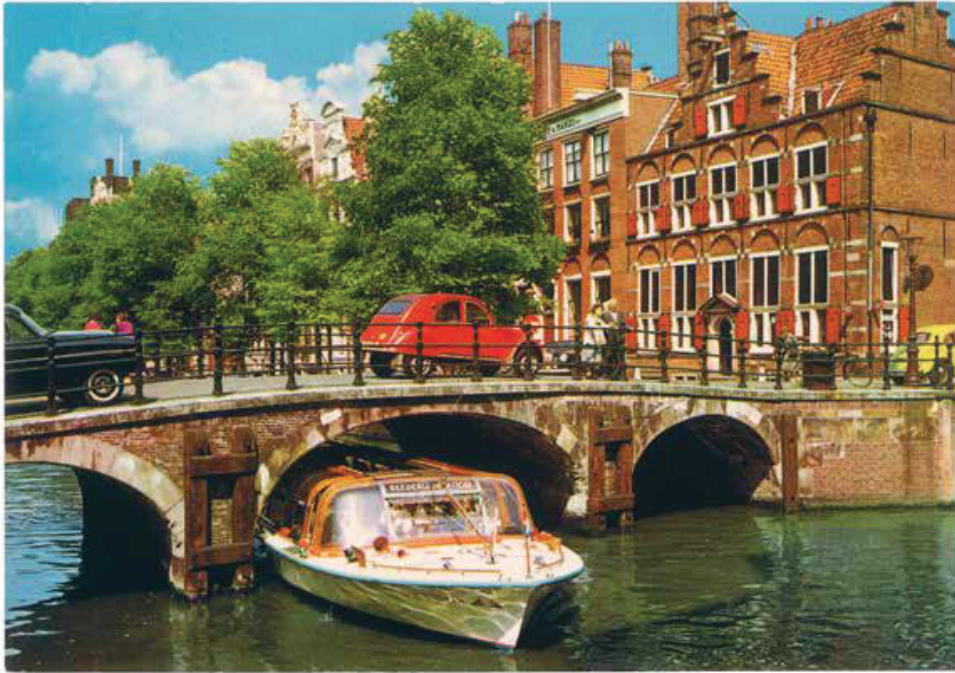
O. Z. Voorburgwal met Huis aan de drie grachten, Amsterdam , Nederland